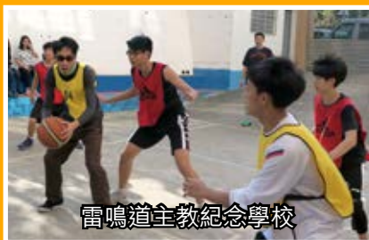
雷鳴道主教紀念學校