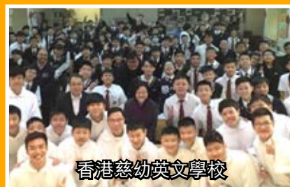
香港慈幼英文學校