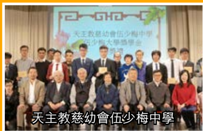
天主教慈幼會伍少梅中學