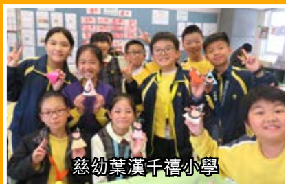
慈幼葉漢千禧小學