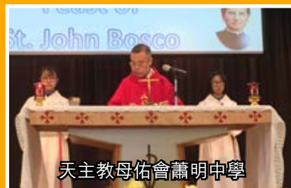
天主教母佑會蕭明中學