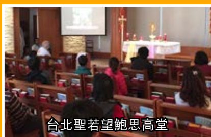
台北聖若望鮑思高堂