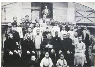
1906年4月2日，澳門教區鮑理諾主教出席開學典禮

1910年，因地方不敷應用，雷鳴道神父獲批准接管風順堂街16號，並創辦無原罪工藝學校。由於校舍建築是一所二層高的木樓，橫廣約數十尺，左右平列共十六楹，因而有「十六柱」的俗稱。