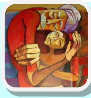
慈幼會 Guillermo Basañes 神父 總部傳教議員

慈幼傳教士應該呼吸和散發預防教育法的魅力；這教育法為我們來說，是教育和福傳的模式。許多慈幼傳教士很自然和明確地這樣說：「這裡有一個眾人的朋友」。事實上，人們可以把這句話作為他們的墓誌銘。他們「置身於青少年之中，他們的臨在是兄長般的、積極的、充滿友誼的」（憲 39），「正如天主聖子降生成人，在各方面類似祂的兄弟，慈幼傳教士也取納當地人民原有的價值，分擔他們的憂慮，分享他們的希望」（憲 30）。可敬者西滿·斯魯吉修士，是慈幼會崇高且亮麗的榜樣，充滿友善和憐憫的心懷。他的一個學生作證說：「他的善良是這樣的一他很單純地只需被傾聽和被愛。憑著對我們年輕人的愛，他贏得了我們的尊敬、贏得了我們的靈魂。」看哪！憐憫的真福，讓慈幼會會士成聖！時常成為每個人的真正朋友；這是慈幼傳教士的智慧。